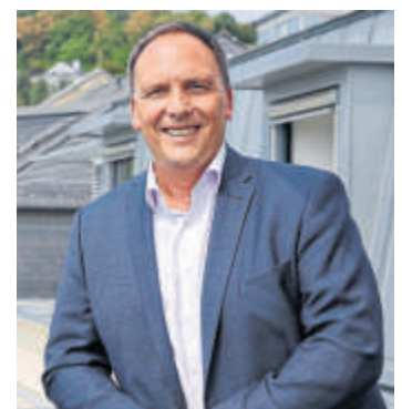
Bürgermeister Klaus Kreß.

Schließlich möchte ich mich auch bei den Bürgerinnen und Bürgern unserer Stadt bedanken – für Ihre Geduld während der vergangenen acht »thermenlosen« Jahre und für die offensichtliche Begeisterung, mit der Sie seit der Eröffnung am 19. Dezember 2023 die Sprudelhof Therme frequentieren. Möge unsere Therme ein Erfolgs-