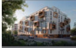
WOHNANLAGE WENDENSCHLOSSSTRASSE, BERLIN