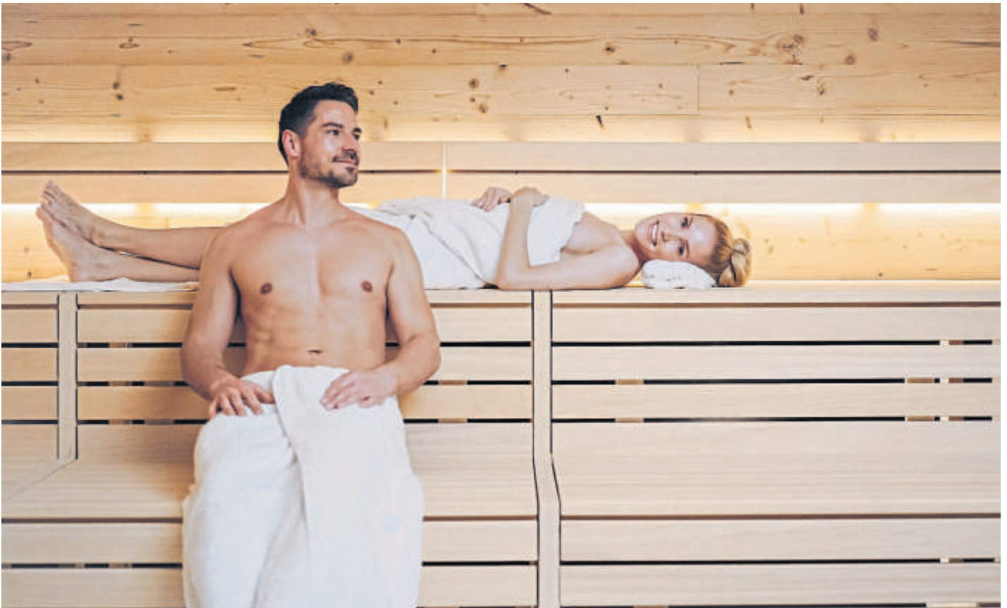
Wohltuende Wärme im SaunaGarten.