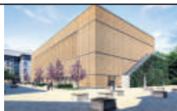
SPORTHALLEN LIEBIGSCHULE GIESSEN

Tel.: +49 6031 6002-0 www.blfp.de info@blfp.de