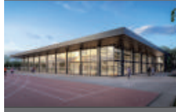
SPORTHALLE RIEDBERG II, FRANKFURT