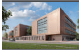
JOSEPH-BELUY'S SCHULCAMPUS, DÜSSELDORF