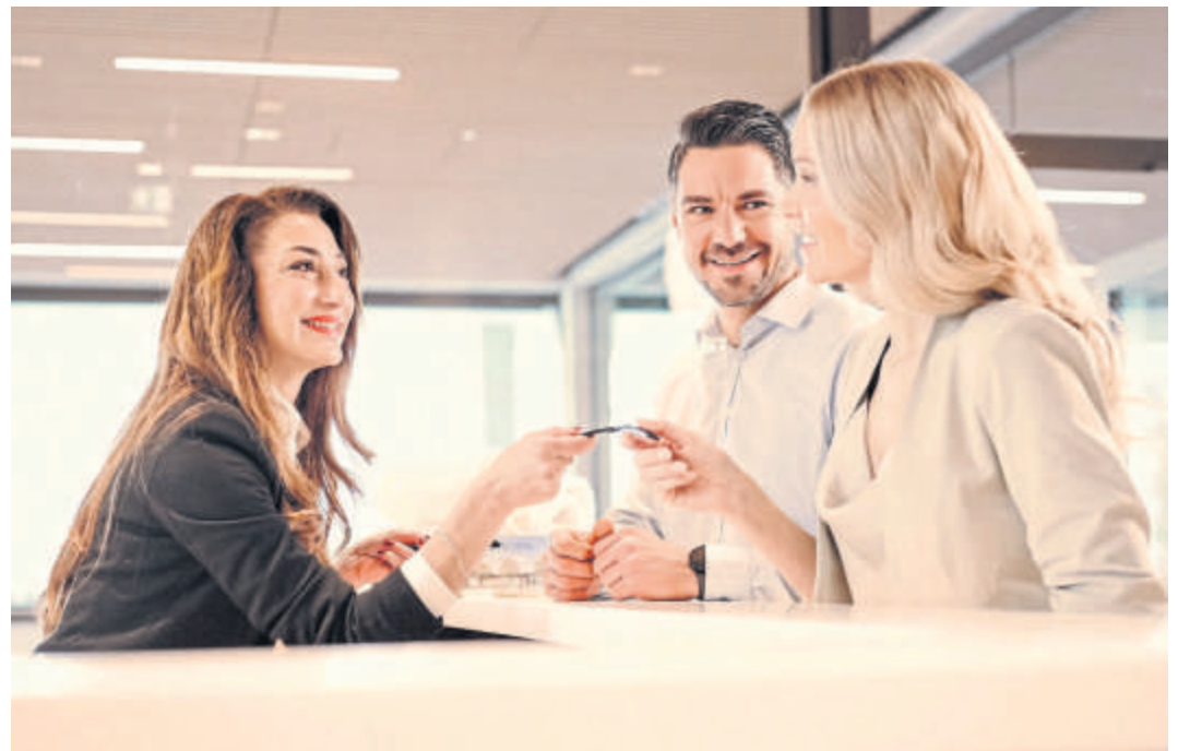
Service wird hier großgeschrieben.

Im Bereich der Beratung und des Verkaufs sind die Mitarbeiter der Therme stets darauf bedacht, den Gästen ein maßgeschneidertes Wellnesserlebnis zu ermöglichen. Hier kann man sich nicht nur umfassend über die verschiedenen Aktivitäten und Gutscheine informieren, sondern auch individuell beraten lassen. Besonders hervorzuheben ist die Möglichkeit, das Bad Nauheimer Baderitual im Voraus zu buchen, um sich einen festen Platz im Wellness-Programm zu sichern. Dieser Service ermöglicht es den Gästen, ihr Wellness-Erlebnis genau nach ihren