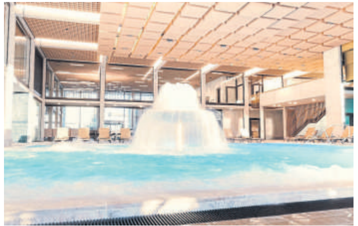
Einfach abtauchen und den Alltag vergessen.