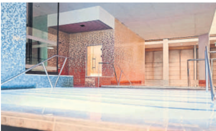
Das Wellness-Erlebnis ist so nah.

Ein besonderes Highlight in diesem umfassenden Angebot sind die Bonuskarten der Sprudelhof Therme. Die Bonuskarten sind in den Varianten Silber, Gold und Platin erhältlich und bieten den Gästen eine attraktive Möglichkeit, von exklusiven Vorteilen zu profitieren. Je nach gewählter Karte kann man diese mit einem Mindestbetrag von 100, 200 oder 400 Euro aufladen und